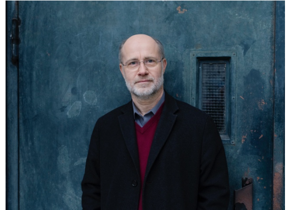
Harald Lesch