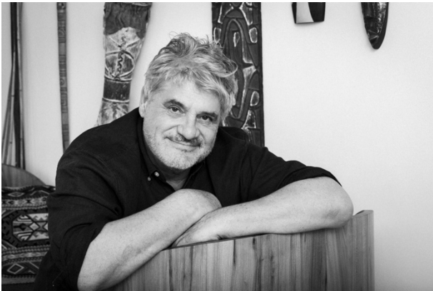
Raoul Schrott

Lesung und Gespräch. Moderiert von Denis Scheck.