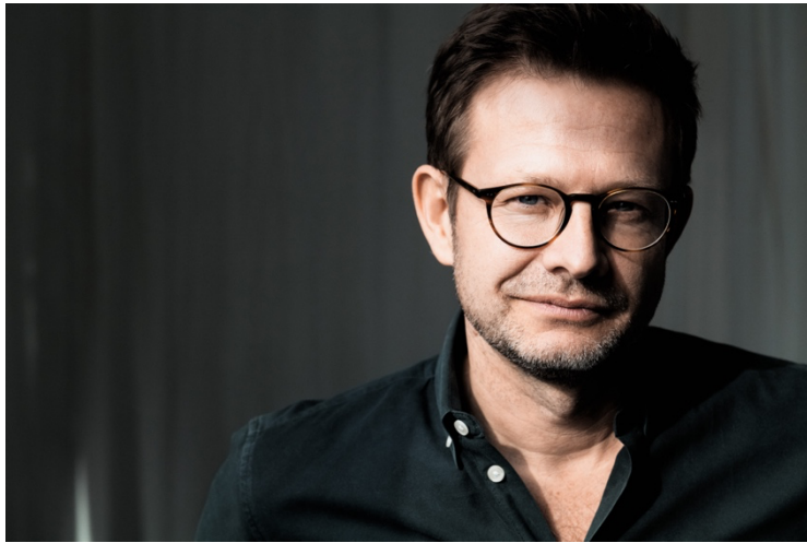
Florian Illies