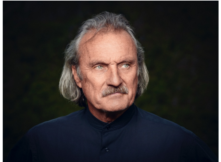
Christoph Ransmayr

Seit seinem Debut „Die Schrecken des Eises und der Finsternis“ macht Christoph Ransmayr neugierig auf die Welt. In Texten von hypnotisierender Schönheit steckt seine Sprache mit dieser Neugier an. Ransmayr erzählt von Aufbrüchen und Heimkünften, Fernweh, Irrfahrten, Gipfelerstürmungen und Welterkundungen, Gängen über Fels und Eis, aber auch über die Abgründe unseres eigenen Bewusstseins. Christoph Ransmayr ist nicht nur einer unserer sprachmächtigsten Gegenwartsautoren, sondern auch ein leidenschaftlicher Hobbyastronom. Immer wieder spielt die Beschäftigung mit Sonne, Mond und Sternen, Sonnensystemen und Galaxien eine Rolle in seinen Texten. Seit einigen Jahren arbeitet Ransmayr an einem neuen Roman, der den Arbeitstitel „Swan oder Der Puls der Sterne“ trägt. In Potsdam spricht Christoph Ransmayr erstmals über dieses work-in-progress und liest u.a. seine Erzählungen „Die Sternepflücker“ und „Im Weltraum“ aus „Atlas eines ängstlichen Mannes“.