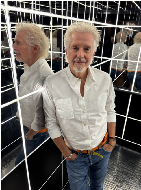
Frank Schätzing