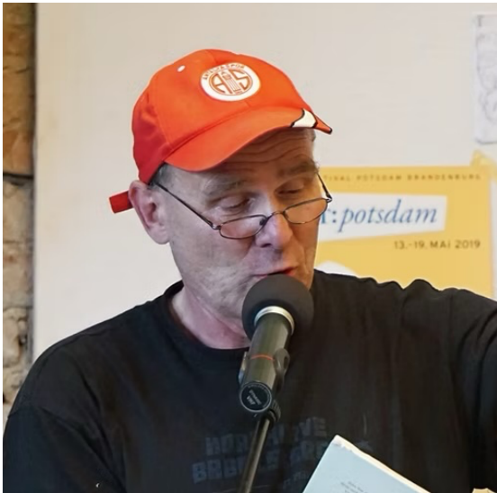
Martin Klein

Martin Klein: Das kleine Dings aus dem All. Ravensburg: Ravensburger 1998. Autorenlesung.