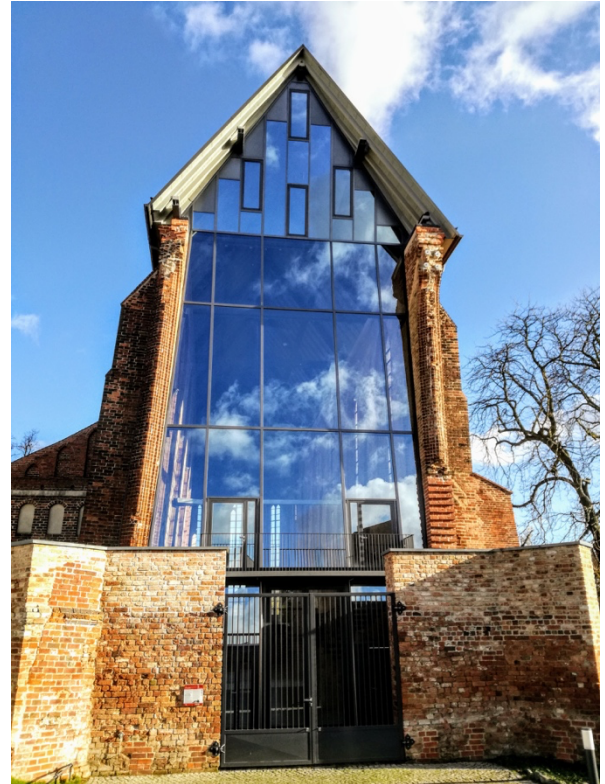
St. Johanniskirche