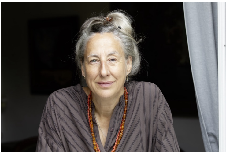
Judith Hermann